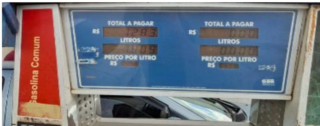
Foto acima mostra o valor de R$ 12,83 (doze reais e oitenta e três centavos) para custear a viagem de ida de Ponto Chique a Ibiai.

A foto abaixo comprova o total de KM do trajeto ida e volta a íbiai: