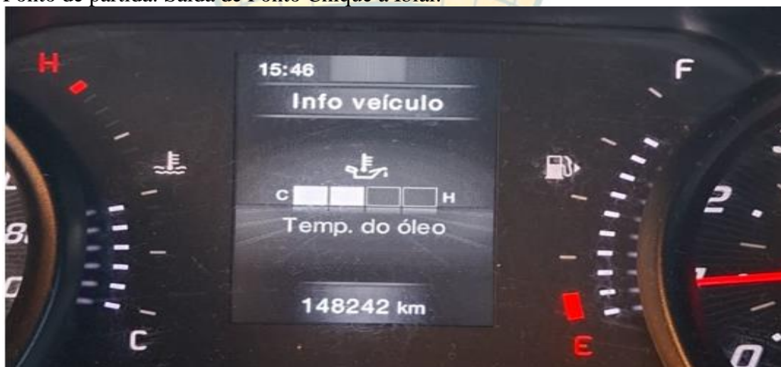
Foto abaixo do KM do veículo na chegada do primeiro posto de combustível no município de Ibiáí:

Ponto de partida: Saída de Ponto Chique á Ibiáí: