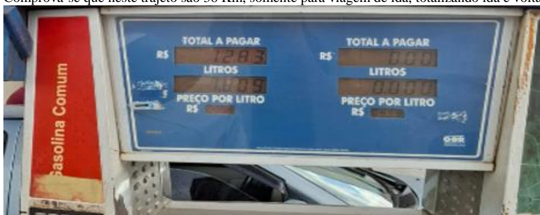
Foto acima mostra o valor de R$ 12,83 (doze reais e oitenta e três centavos) para custear a viagem de ida de Ponto Chique a Ibiaí.

Comprova-se que neste trajeto são 36 Km, somente para viagem de ida, totalizando ida e volta 72 KM.