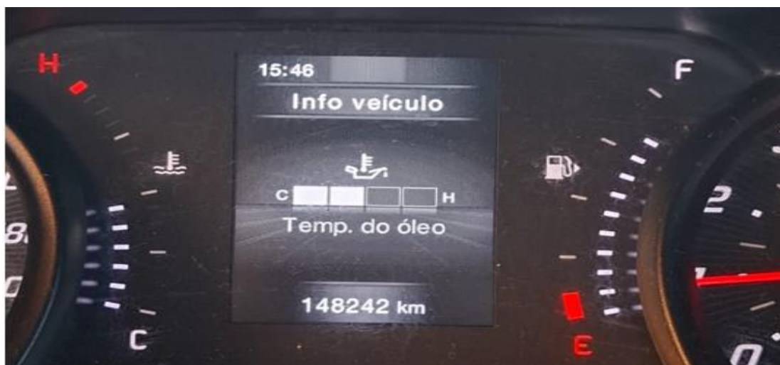
Foto abaixo do KM do veículo na chegada do primeiro posto de combustível no município de Ibiaí: