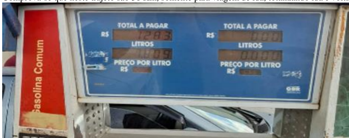
Foto acima mostra o valor de R$ 12,83 (doze reais e oitenta e três centavos) para custear a viagem de ida de Ponto Chique a Ibiai.

Comprova-se que neste trajeto são 36 Km, somente para viagem de ida, totalizando ida e volta 72 KM.